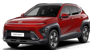
Ultimate Red Metallic Metalická Kombinace dostupná také s černým lakováním střechy Cena: 17 900 Kč