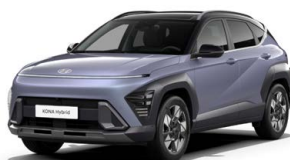
Meta Blue Pearl Perleťová Kombinace dostupná také s černým lakováním střechy Cena: 17 900 Kč