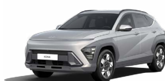
Shimmering Silver Metallic Metalická Kombinace dostupná také s černým lakováním střechy Cena: 17 900 Kč