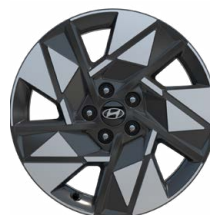
18" kola z lehké slitiny