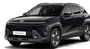
Abyss Black Pearl Perleťová Cena: 17 900 Kč