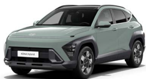
Mirage Green Pastelová Kombinace dostupná také s černým lakováním střechy Cena: 0 Kč