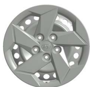
16" ocelová kola s celoplošnými kryty