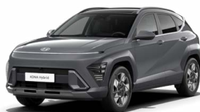
Ecotronic Gray Pearl Perleťová Kombinace dostupná také s černým lakováním střechy Cena: 17 900 Kč