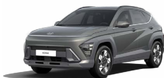
Amazon Gray Metalická Kombinace dostupná také s černým lakováním střechy Cena: 17 900 Kč