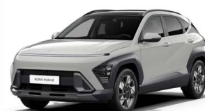
Cyber Gray Metallic Metalická Kombinace dostupná také s černým lakováním střechy Cena: 17 900 Kč