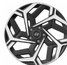
Unikátní N Line 18" kola z lehké slitiny