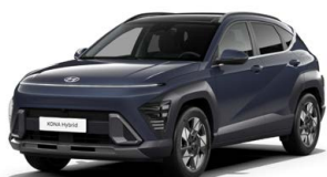
Denim Blue Pearl Perleťová Kombinace dostupná také s černým lakováním střechy Cena: 17 900 Kč