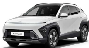
Atlas White Pastelová Kombinace dostupná také s černým lakováním střechy Cena: 9 900 Kč