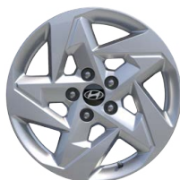
17" kola z lehké slitiny