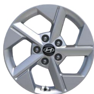
16" kola z lehké slitiny